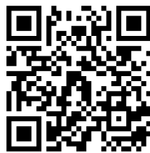
(แบบประเมินหลัง)

๑๐. ขอให้ผู้เข้าสอบทุกคน ทำแบบสอบถามเพื่อประเมินผลการป้องกันการแพร่ระบาดของโรคติดเชื้อไวรัสโคโรนา 2019 (COVID-19) ภายหลังจากเข้ารับการประเมินสมรรถนะ ไปแล้ว โดยให้สแกน QR Code หรือเข้าไปที่ https://forms.gle/H3Hu6jzeDr5AZgT46 โดยสามารถตอบแบบสอบถามได้ตั้งแต่วันที่ ๑๑ - ๑๕ สิงหาคม ๒๕๖๔ เพื่อการติดตามผลและป้องกันการแพร่ระบาดของโรคติดเชื้อไวรัสโคโรนา 2019 (COVID-19)